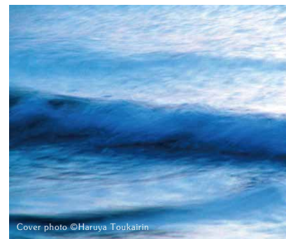
Cover photo ©Haruya Toukairin